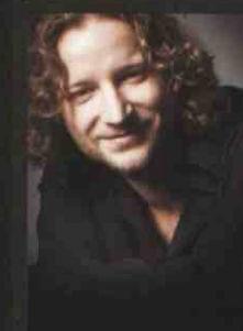
Artur Nelkowski Astolfo, książę Moskwy