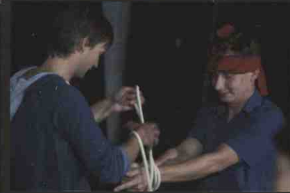
zdjęcia z prób do spektaklu