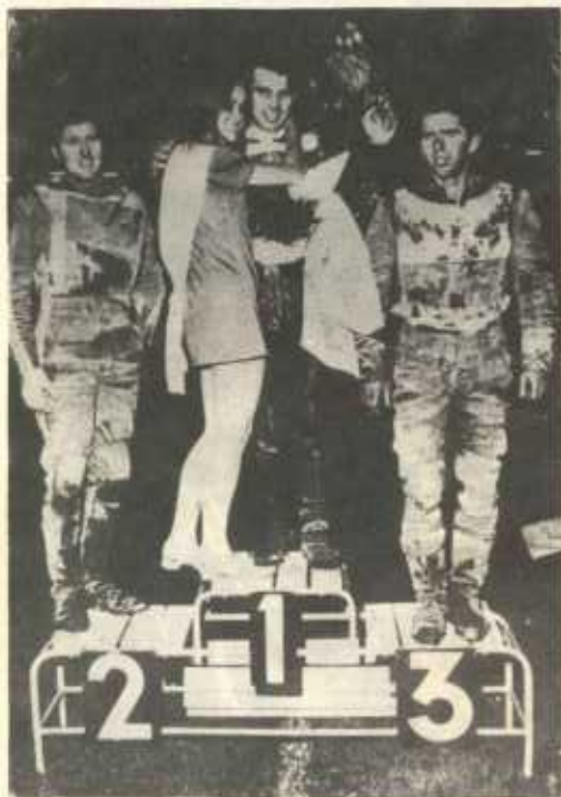
Edward Jancarz na podium IMSw. '68 w Göteborgu w otoczeniu Ivana Maugera i Barry Briggsa.