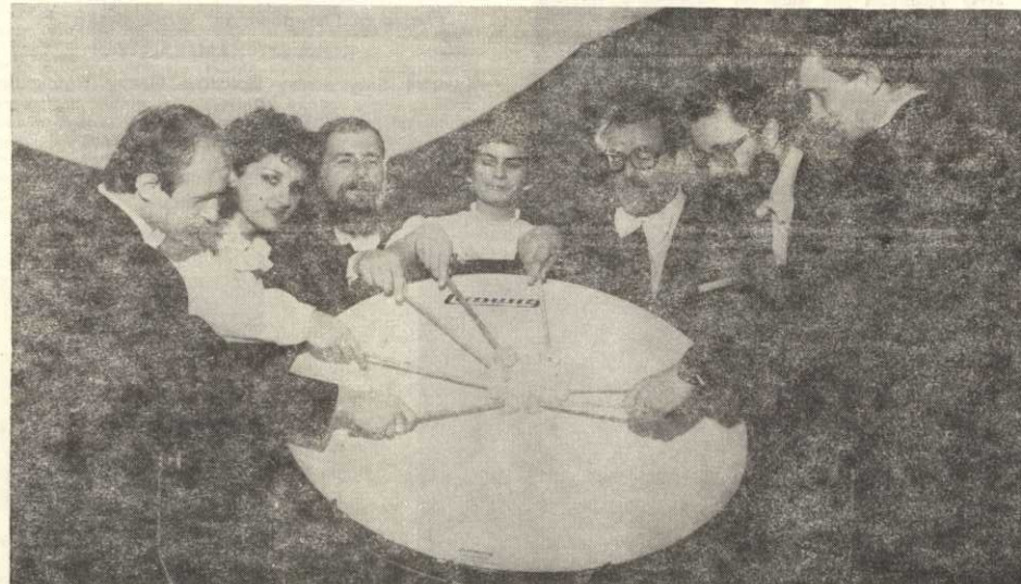
POZNAŃSKI ZESPÓŁ PERKUSYJNY

70 w Rumunii, 74 trzykrotnie w NRD. Wszędzie wzbudziła ogólne uznanie i spotykali się z przychylną krytyką. Udział w Festiwalu Muzyki Współczesnej (Berlin) przyniósł im w r. 1973 nagrodę Krytyki Muzycznej. Również w roku 1973 Poznański Zespół Perkusyjny wystąpił z dużym powodzeniem na jednym z koncertów Warszawskiej Jesieni. W roku 1974 natomiast otrzymał medal „Łódzkiej Wiosny Artystycznej”. W roku 1978 Zespół zostaje zaproszony na tournée do NRD, w lipcu tegoż roku odnotowano 3 występy w nowo zbudowanym Pałacu Republiki w Berlinie. W roku 1978 Zespół koncertuje w Hanowerze w ramach odbywających się tam „Tage der Neuen Musik”, w 1980 daje 3 koncerty w Ośrodku Kultury Polskiej w stolicy NRD. W lutym 1981 Poznańscy Perkusiści zostają ponownie zaproszeni do udziału w Festiwalu Muzyki Współczesnej w Berlinie. W 1983 roku Poznański Zespół Perkusyjny wystąpił w Hanowerze w ramach cyklu „Neue Musik in Polen”. Poznański Zespół ma także na swym koncie płytę długogrającą z nagraniami polskiej muzyki perkusyjnej.