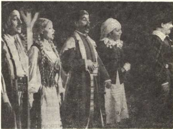
U góry: Fragment z opery „NĘDZA USZCZĘŚLIWIONA”, u dołu: Orkiestra KZP KOSTRZYŃ

Muzyka zespołu pełna humoru i szczeroci jest czymś nowym nie tylko w skali naszego kraju ale również w skali europejskiej. Dowodem uznania jest zaproszenie na festiwal Nancy Jazz Pulsation we Francji, gdzie wystąpią wspólnie z zespołami takich gwiazd polskiego jazzu jak T. Stańko i T. Szukalski.