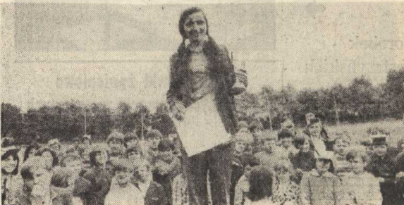
Kapitan zespołowej drużyny szachy nr 1 w chwili po terożeniu pucharu dyrektora KZP