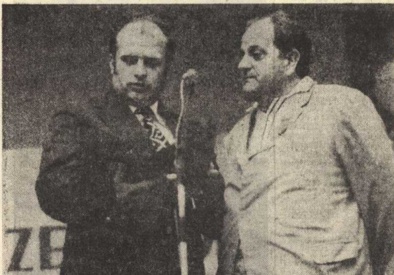
Przyjaźnielskie życzenia i podziękowania dla kostrzyńskiej szatni składu przedstawicieli Zakładów Papierniczych w Schwedzie (NRD)