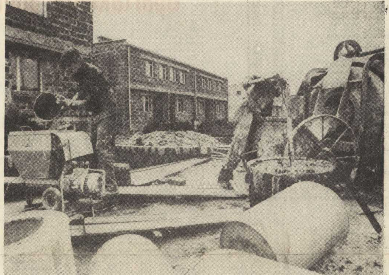
Wre praca na budowie