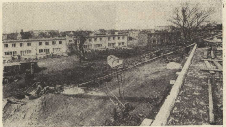
Widok ogólny na Osiedle Domków Jednorodzinnych

Nie pobiera się kaucji od osób przekwalifikowanych na podstawie decyzji o lokalu zamiennym.