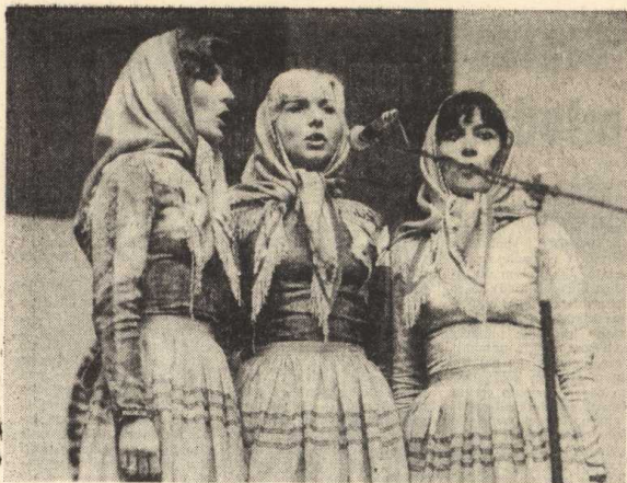
Występuje Pomorska Estrada Wojskowa „Czarne herety”