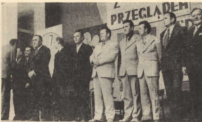
Moment dekoracji odznaki „Zasłużonego dla Kostrzyńskich Zakładów Papierniczych”