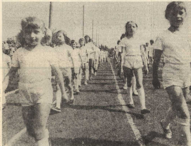
Maszerują najmłodsi uczestnicy spartakiady