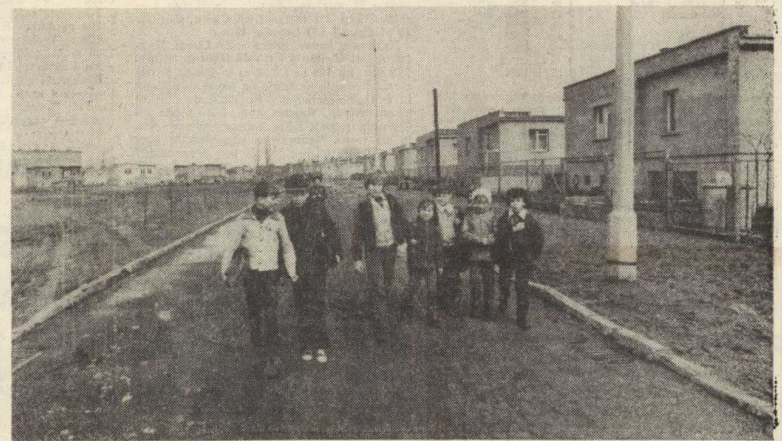
Droga łącząca szkołę z Osiedlem Domków Jednorodzinnych

Czasami warto się zastanowić co się i gdzie mówi czy robi. Omawiać i krytykować innych można wówczas, gdy się ma czyste swoje konto. O tym warto pamiętać. Kultura codzienna to nie tylko czyni lecz i również słowa.