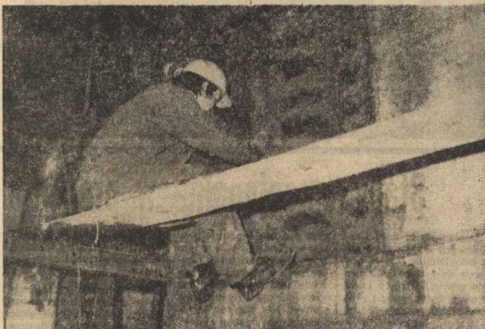
Wydział Energetyczny. Kociołownia węglowa. Remont kotła węglowego nr 1