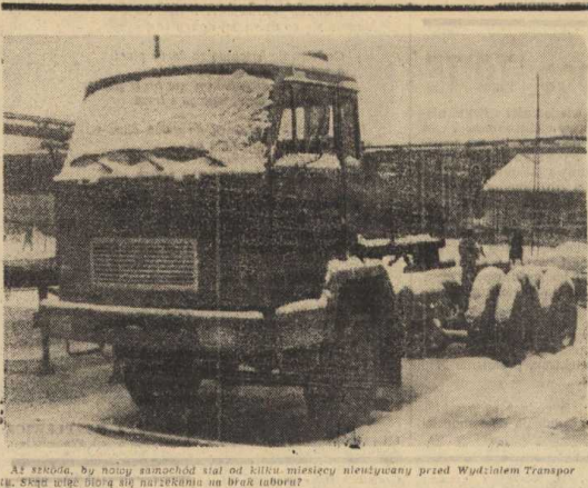
Aż szkoda, by niecy samochód miał od kilku miesięcy nieustannie przed Wydziałem Transportu. Stała się... (i.s.)