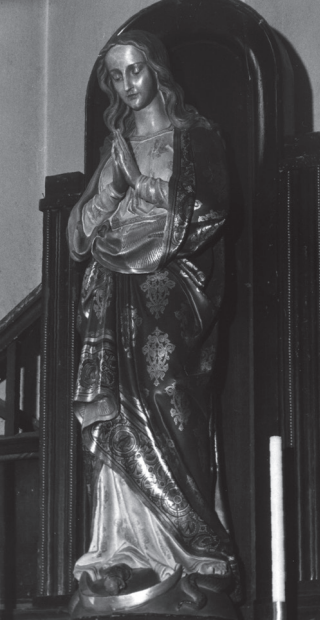
Die Statue der Gottesmutter im Nebenalтарь.

Josephspfarckirche in Gorzów Wlkp. an der Bracka – Strasse. Poznań 1980 Jh.