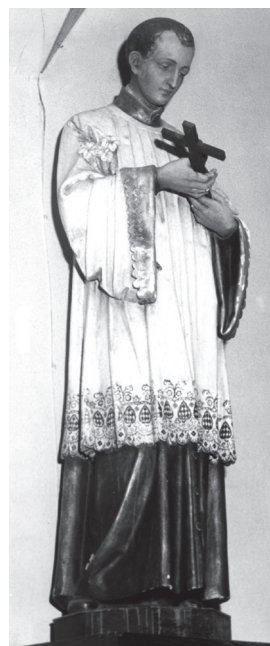
Figura św. Stanisława Kostki