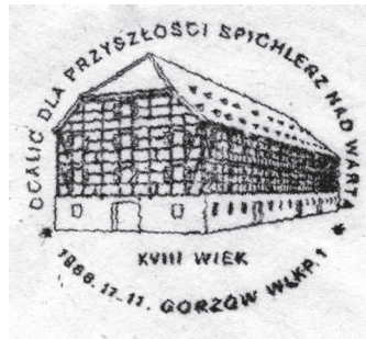
Datownik pocztowy z widokiem spichlerza