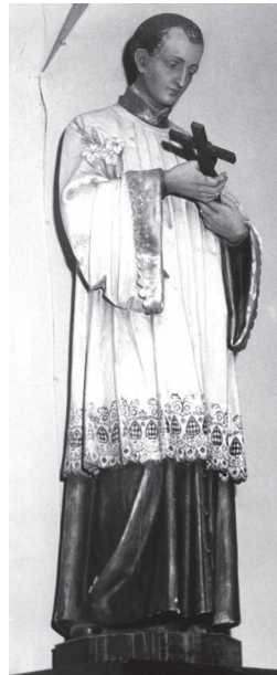
Die Statue der heiligen Stanisław Kostka.