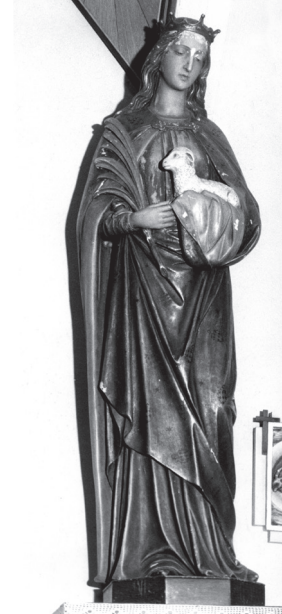
Die Statue der heiligen Agnes.