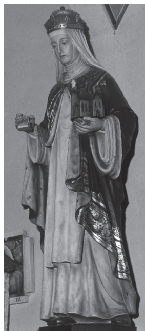
Figura św. Cecylii