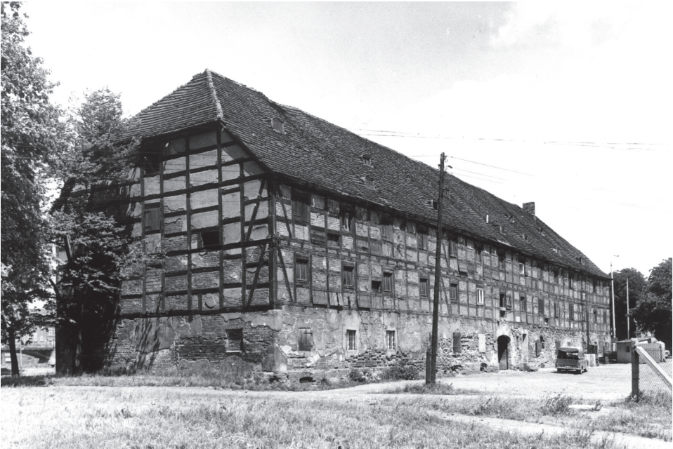
Der Speicher aus der zweiten Hälfte des achtzehnten Jahrhunderts an der Fabryczna- Strasse.