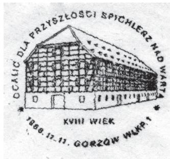
Der Briefstempel mit der Ansicht von dem Speicher.