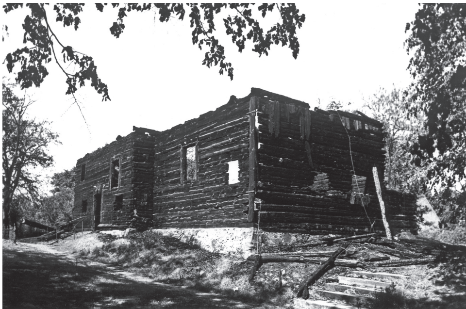
Martinstochterkirche in Bukowiec, im Landkreis Międzyrzecz; nach dem Brand im Jahre 1978.