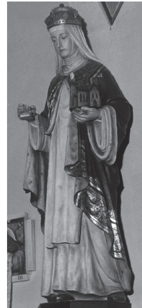
Die Statue der heiligen Hedwig.