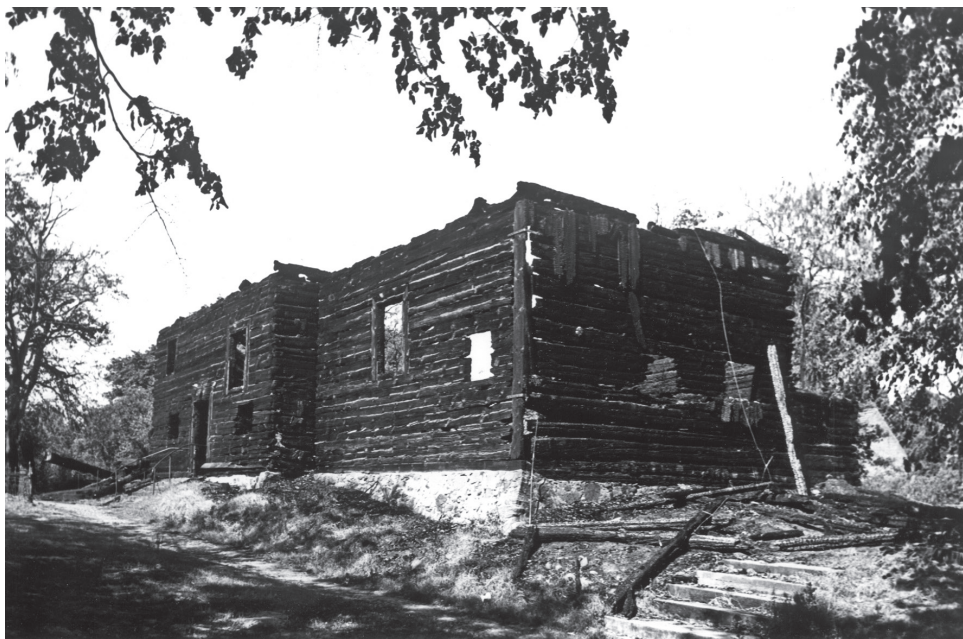
Kościół filialny pod wezwaniem św. Marcina w Bukowcu, pow. Międzyrzecz po pożarze w czerwcu 1978 r.