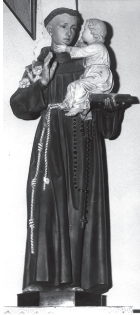
Die Statue vom heiligen Antonius Padewski mit Gotteskind.