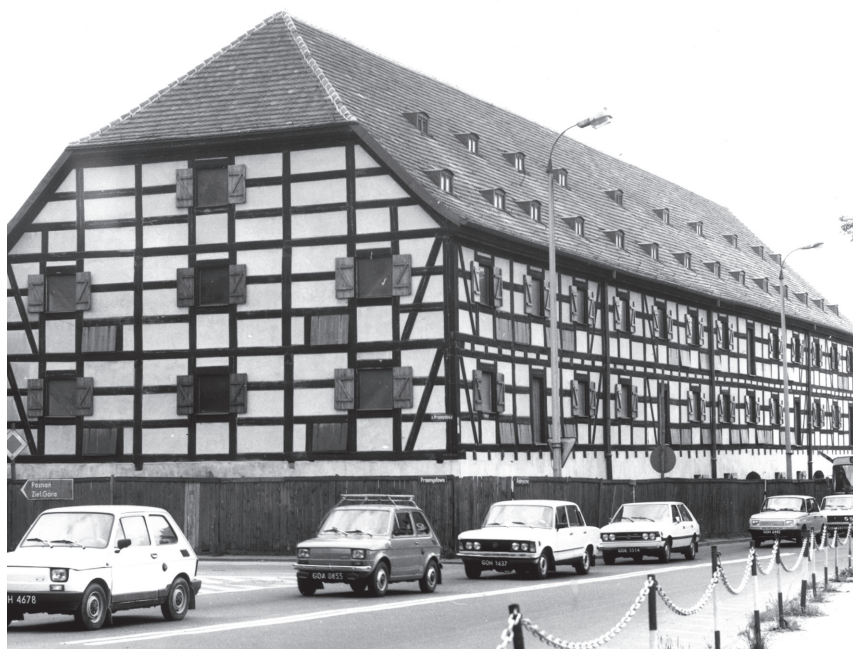
Spichlerz przy ul. Fabrycznej po remoncie, oddany do użytku 11 listopada 1988 r.