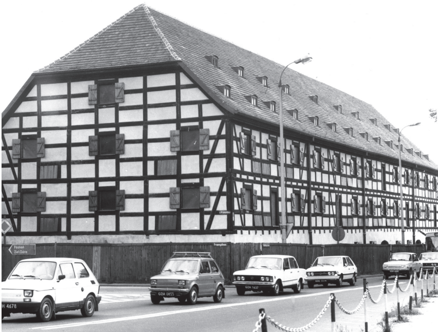
Der Speicher nach der Renovierung, der am elften November 1988 zum Gebrauch überlassen wurde.