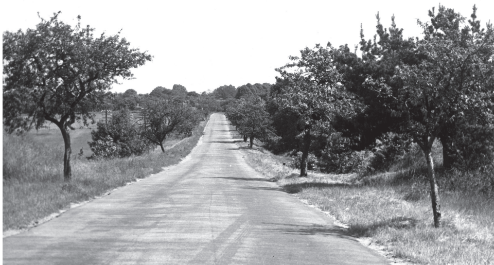
Der Verlust im Dorfpanorama, nach dem Brand der Martinstochterkirche in Bukowiec, im Landkreis Międzyrzecz, im Juni 1978.