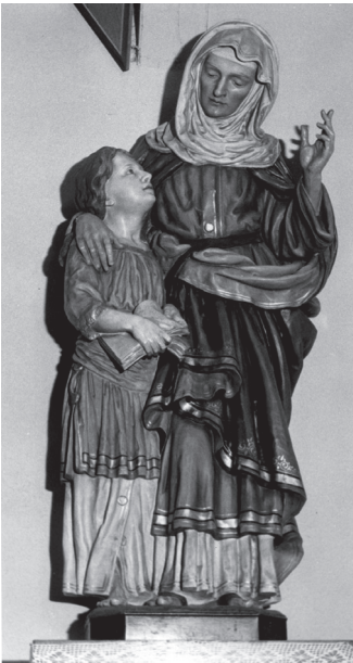
Die Statue der heiligen Anna mit Maria.