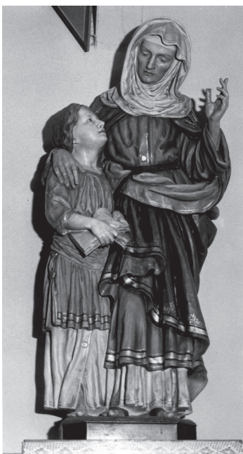
Figura św. Anny Samotrzcę