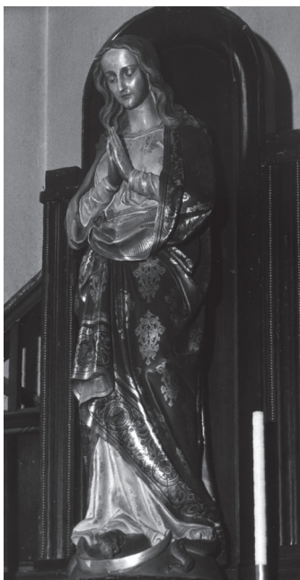
Figura Matki Boskiej

Figury z kościoła pod wezwaniem św. Józefa przy ul. Brackiej w Gorzowie Wlkp. Fotografie H. Nowakowska 1980 r.