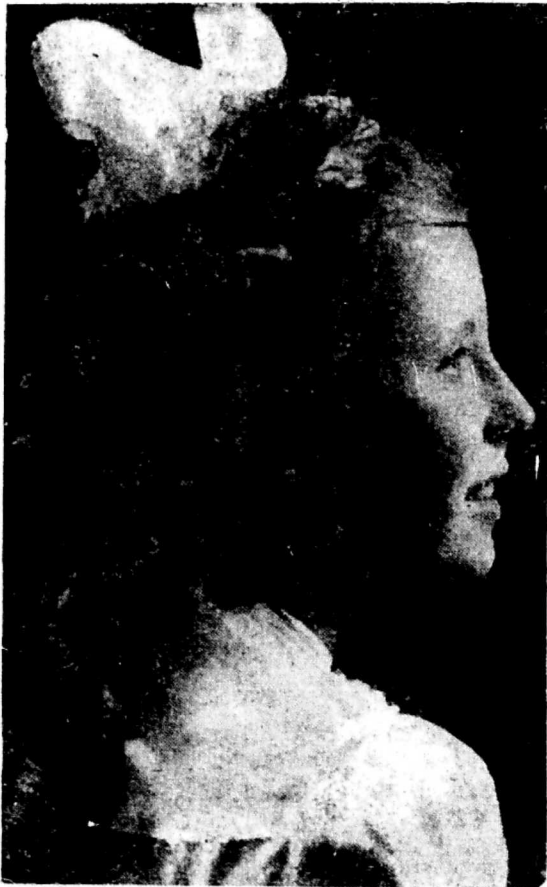
Najszcześniejszy dzień w życiu dziecka.

Tak bardzo się cieszę, że z taką szczerością opisujecie wszystkie wasze dziecinnie zmagania się ze złem. Rośnijcie na dobrych ludzi. Wiedźcie też o tym, że jeszcze niejedna walka z grzechem was czeka, jeszcze niejedyn trud. Dlatego już w dzieciństwie, w młodości, trzeba się do niej przyzwyczajać, by później nie być słabym i nie ulec. Ćwiczcie się zawczasu w cnotach a wtedy wasze charaktery będą silne i nic nie zdoła ich zdruzgotać. Nie wolno wam dzieci być trzęciną chwiejącą się za najłżejszym podmuchem wiatru. Macie wyróżnić na silnych i męźnych, macie ukochać wszelkie piękno, które początek swój wzięło z nieskończonej piękności — Boga.