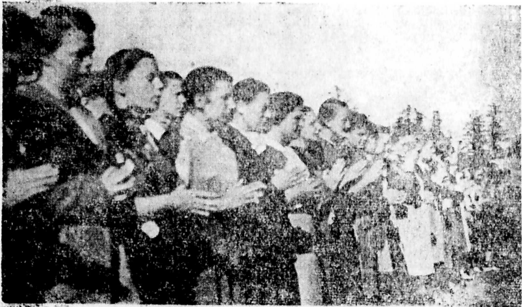
Rodzinka przy modlitwie porannej na Św. Krzyżu.