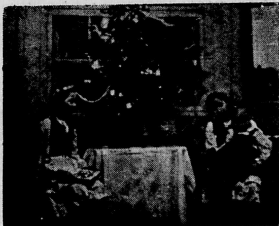
Przy choince śpiewamy koledę

Narodził się Jezus mały w ubogiej stajence, Boże dziecię pełne chwały na sianeczku drzące.