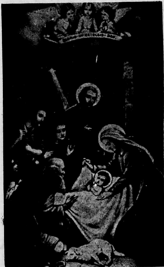
W żłobie leży...

a) W Chrystusie jest tylko jedna Osoba Boska. Natura ludzka Chrystusa nie jest osobą, bo inaczej mielibyśmy dwóch Panów Jezusów: Jezus Człowiek i Jezus Bóg; a tymczasem jeden jest tylko Bóg Człowiek — Natura ludzka Chrystusa należy do Osoby