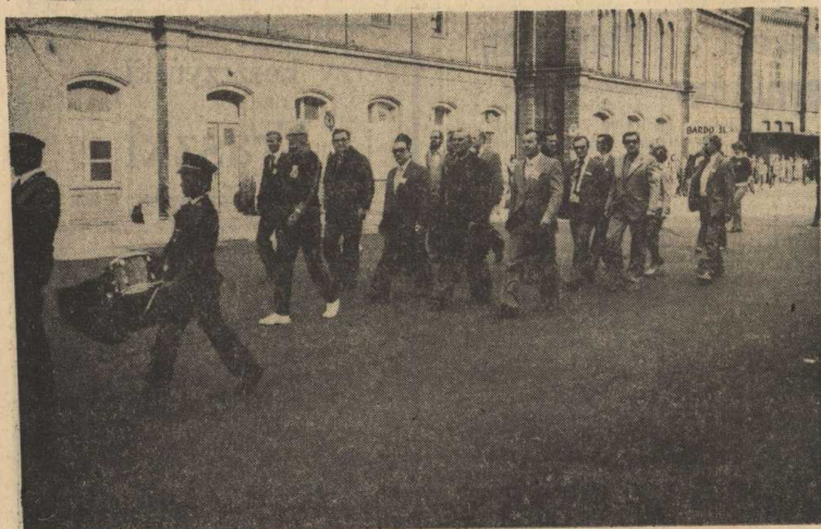
Przemarsz ekip ulicami miasta. Na czele zaproszeni goście oraz gospodarze Spartakiady.