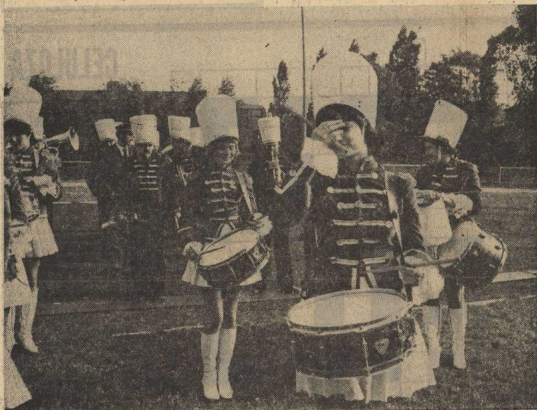
Paradny występ orkiestry dętej z Międzychodu uświetnił uroczystość otwarcia Spartakiady.