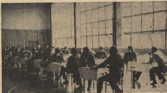
Stachisel na chwilę przed furiejącymi emocjami.