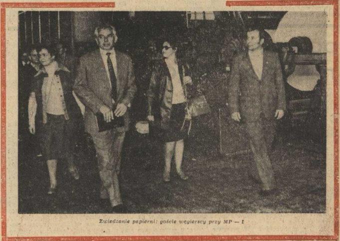
Zwiedzenie papierni: goście węgierscy przy MP-1

W późnych godzinach popołudniowych ekipy sportowe 21 zakładów branży papierniczej rozleciały się do domów, obświadczać sobie spotkanie za rok.