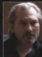
PUSTELNIK Michał Anioł