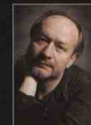
KANCLERZ Krzysztof Tuchalski